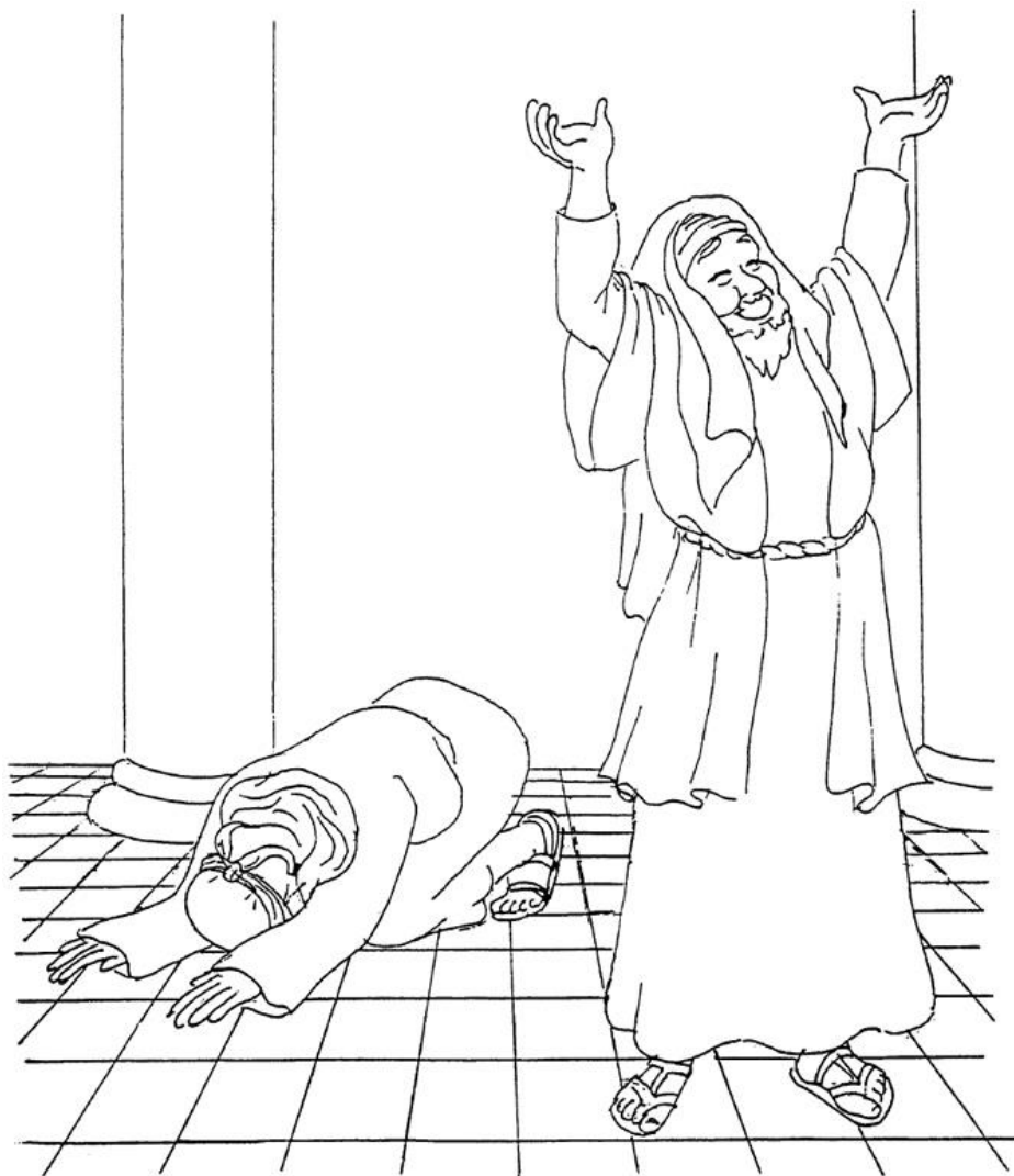
Przypowieść o faryzeuszu i celniku